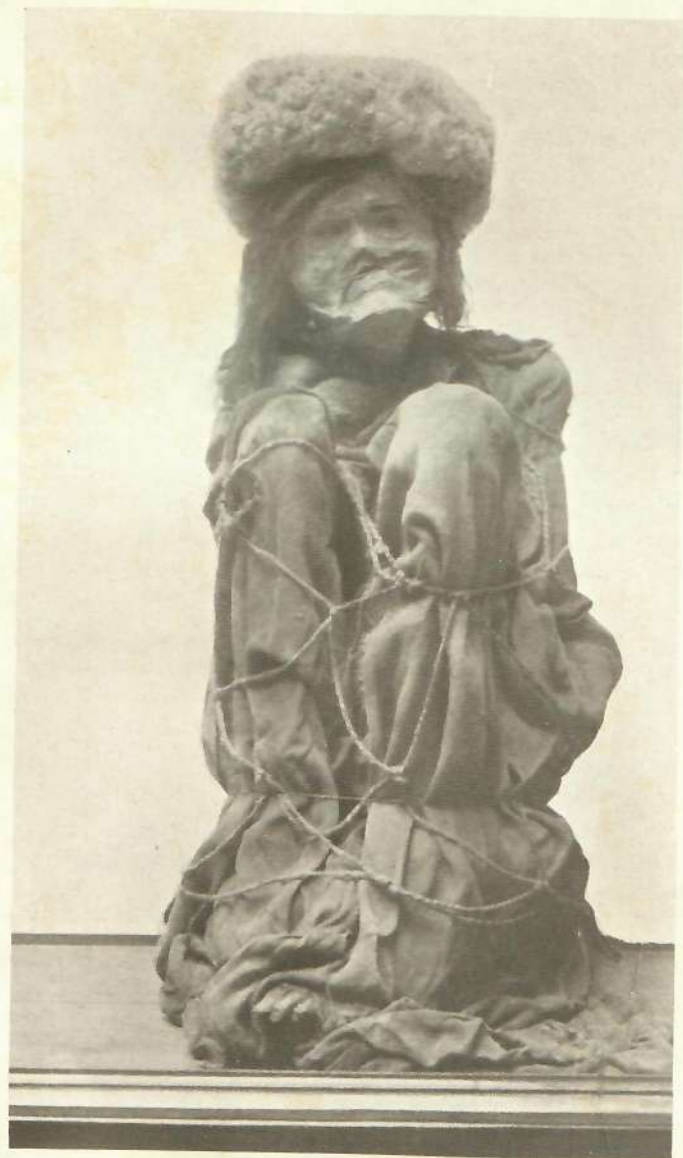
Momía de un antiguo indio del desierto de Atacama.