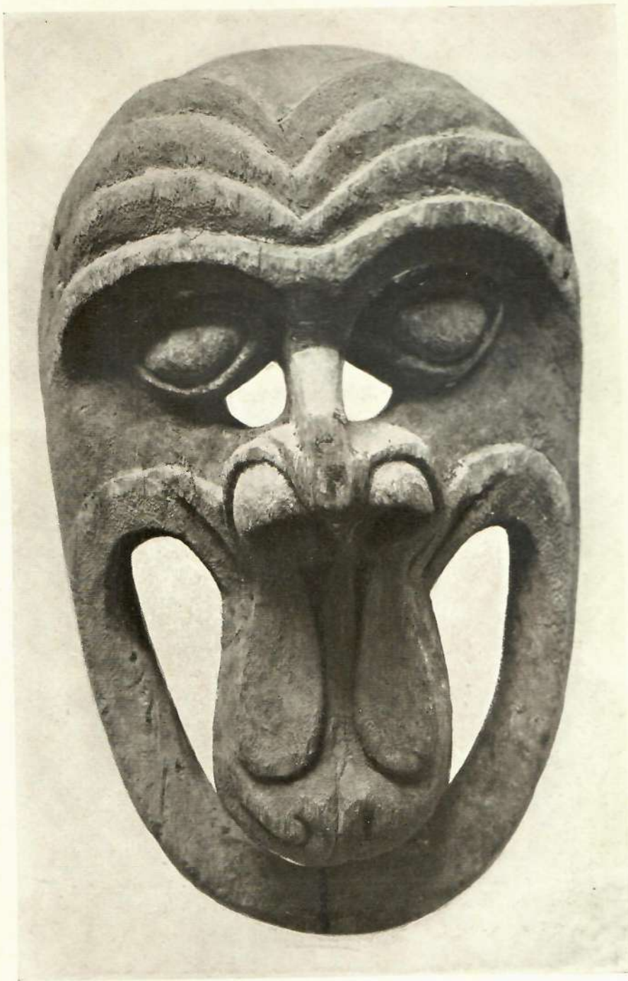
Máscara de madera de los antiguos indios chiquitos , de Bolivia.