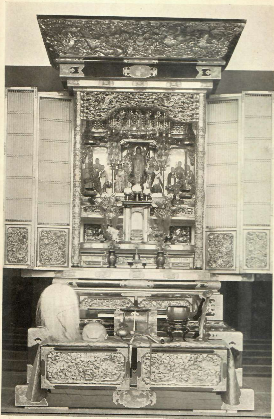
Altar budista de la secta Shin Shú. — Japón.